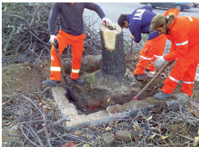
Proceso de extracción de árboles