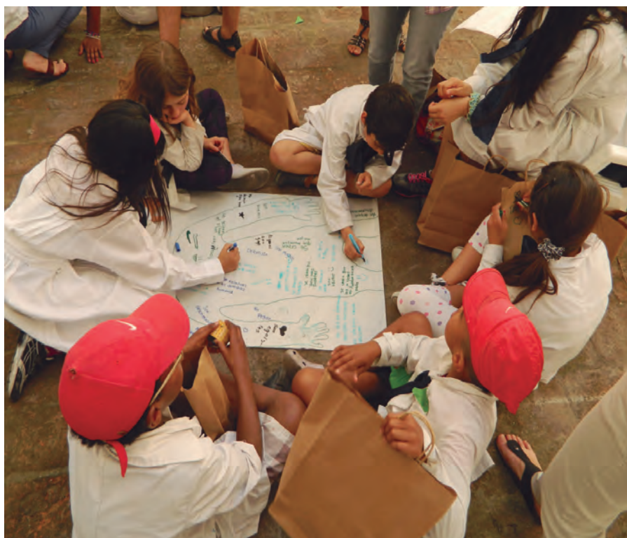
Trabajo en talleres