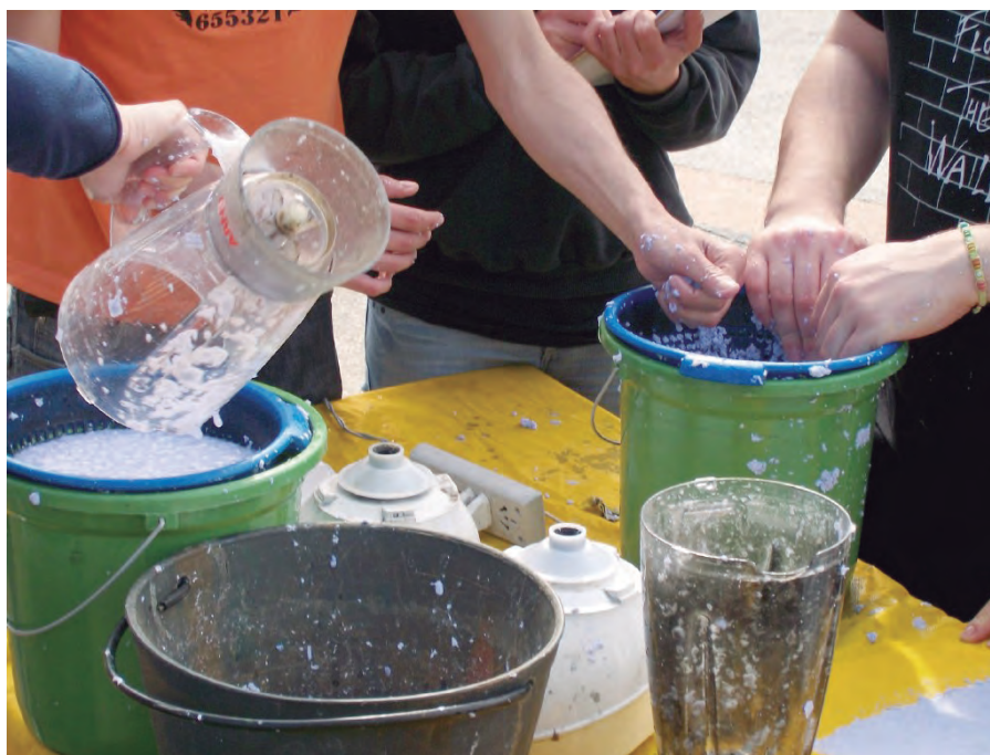
Jornada de reciclaje