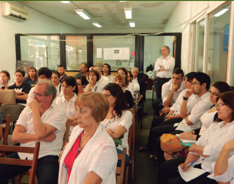
Talleres en CCZ1