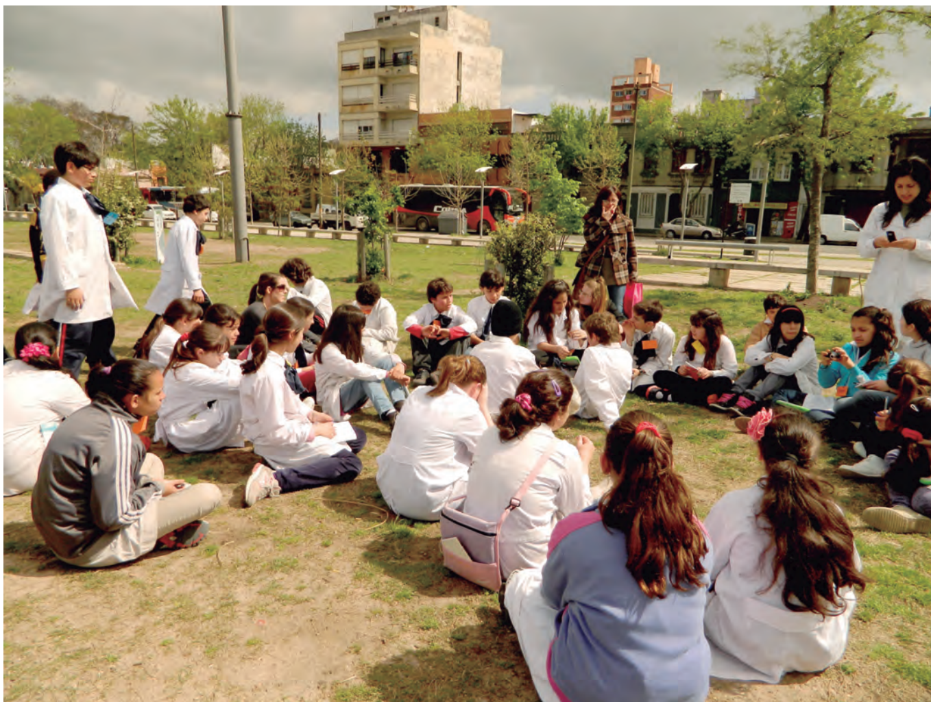
Proyecto Pisando Fuerte

organizada por las Comisiones de Cultura de los Concejos Vecinales 1 y 2.