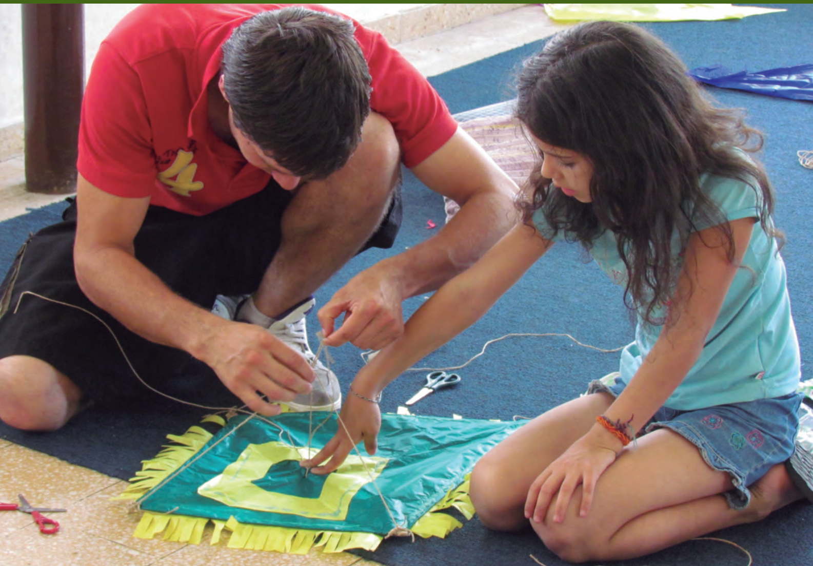
Manos haciendo cultura