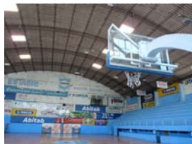
Reacondicionamiento de Club Cordón

Descripción: Obras de acondicionamiento del espacio y equipamiento deportivo