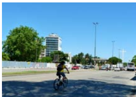
Ciclovía de Terminal Tres Cruces a Facultades Medicina y Química