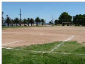
Espacio deportivo infantil Don Bosco apostando a fortalecer valores