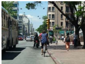
Ciclovía segura entre Facultad de Derecho y Facultades Medicina y Química

Descripción: Creación de ciclovía en tramo a determinar del circuito propuesto