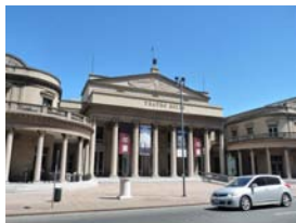
Instrumentos para los niños de la orquesta de Ciudad Vieja