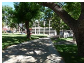
Barrio de las Artes