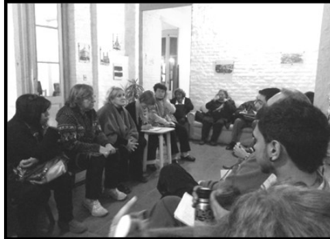
Foto: el Concejo Vecinal 1 reunido en la Casa del Vecino de La Aguada

“Entre sus funciones se encuentra la elaboración de proyectos y planes para mejorar los barrios. ...Actúan como agentes de desarrollo en sus territorios, construyendo una visión integral del mismo, y promueven la articulación de diversos actores para el logro de objetivos comunes como ser comisiones de fomento, organizaciones deportivas, religiosas, culturales sindicales, económicas, etc. “